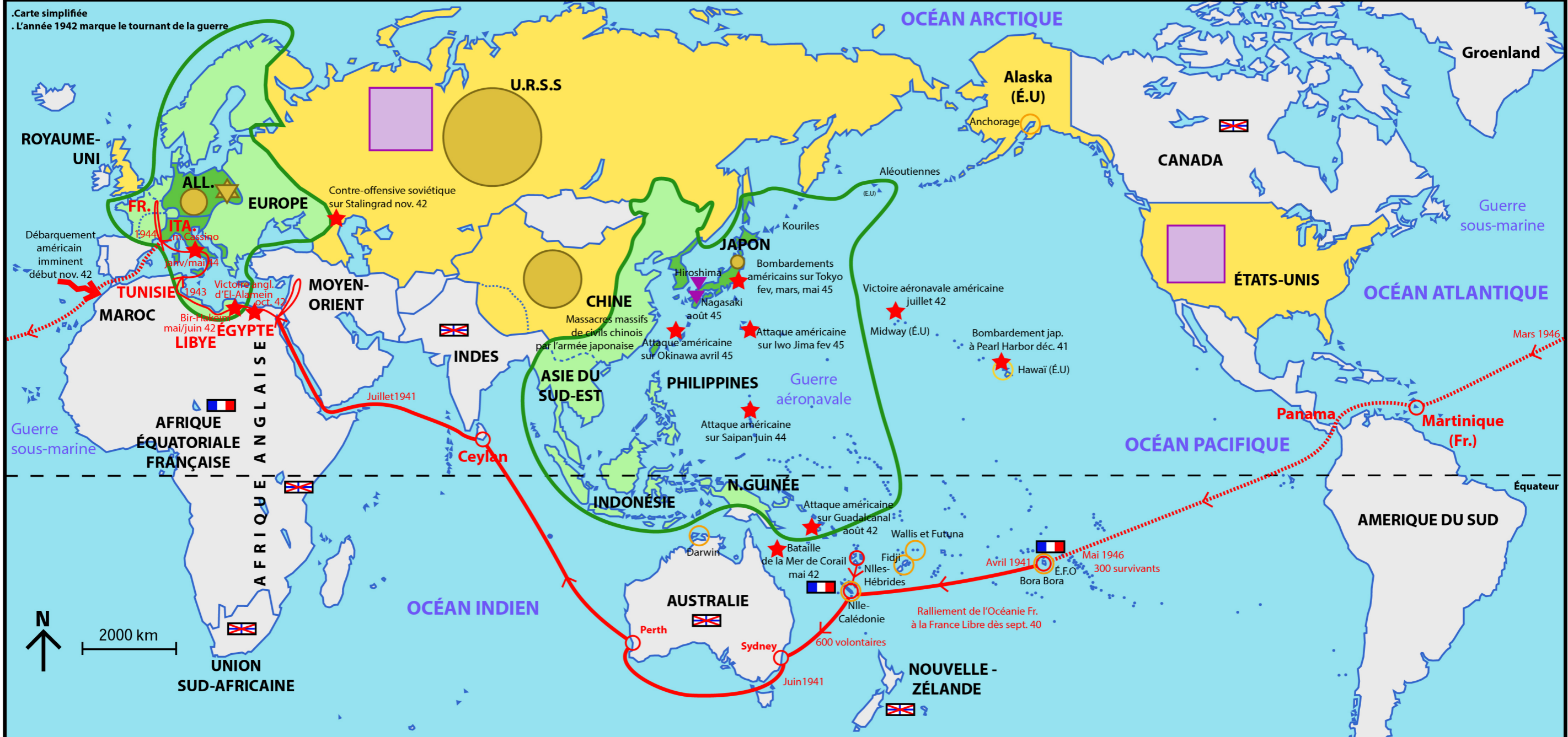
Carte simplifiée L'année 1942 marque le tournant de la guerre