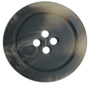
BOUTON PITOPITO BUTTON