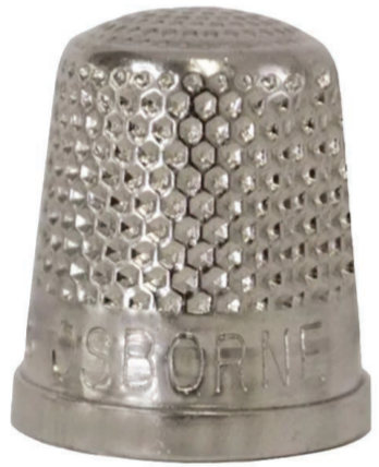
DÉ À COUDRE PŌNAO THIMBLE