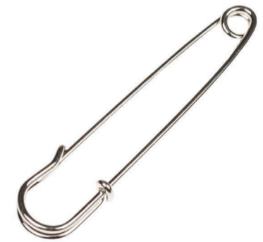
ÉPINGLE À NOURRICE PINE SAFETY PIN