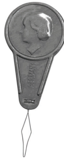
ENFILE-AIGUILLE PĀTUI TAURA NEEDLE THREADER