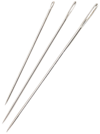
AIGUILLE NIRA SEWING NEEDLE