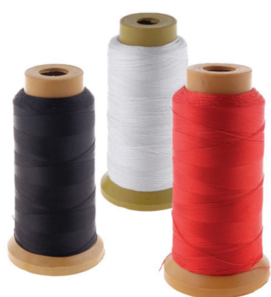
FIL / BOBINE DE FIL TAURA / PŌ'AI TAURA THREAD / SPOOL OF THREAD