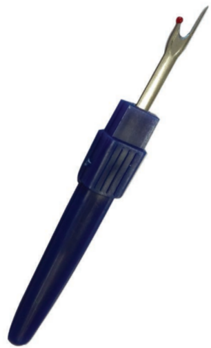
DÉCOUD-VITE TĀPŪ NĪNIRA SEAM RIPPER