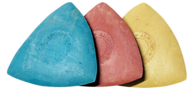
CRAIE TAILLEUR PU'A TĀPA'O TAYLOR CHALK