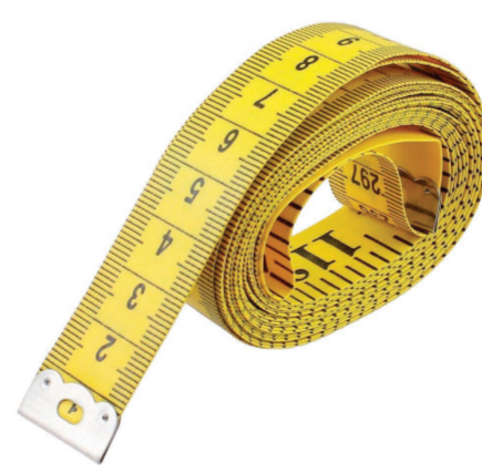
MÈTRE RUBAN MĒTERA AU 'AHU FLEXIBLE MEASURING TAPE