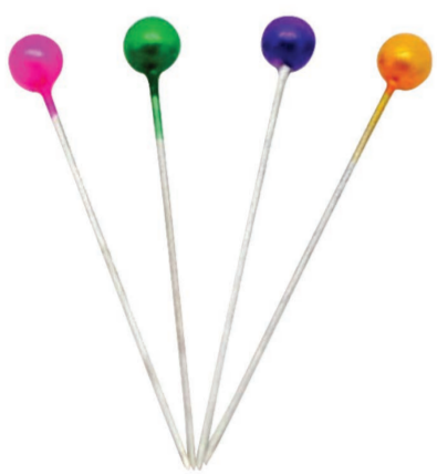
ÉPINGLES À COUTURE PINE 'AHU SEWING PINS