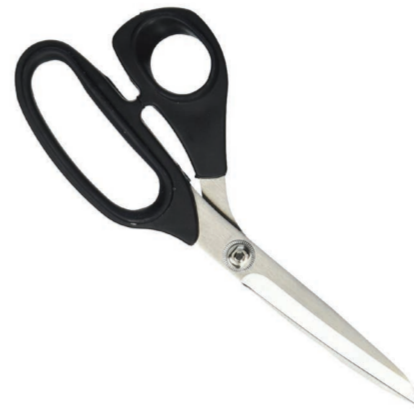
CISEAUX TAILLEUR PĀ'OTI 'AHU TRIMMING SCISSORS