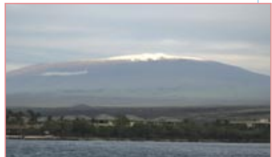
Vue du sommet du Mauna Kea (Hawaï).

Sécheresse : absence ou insuffisance de pluie.