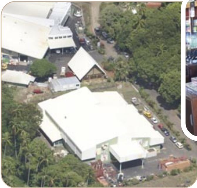
L'usine de jus de fruits de Moorea vue d'avion.