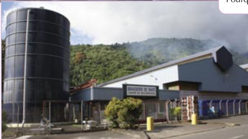
La Brasserie de Tahiti.

Je reconnais les différents types d'aménagement, depuis le lagon jusqu'à la montagne (bord de mer, vallée, hauteurs, fond de la vallée...). Pourquoi a-t-on implanté les usines dans la vallée ?