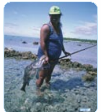
Une bonne pêche