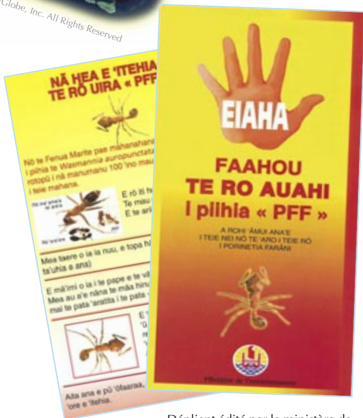
Dépliant édité par le ministère de l'Environnement.