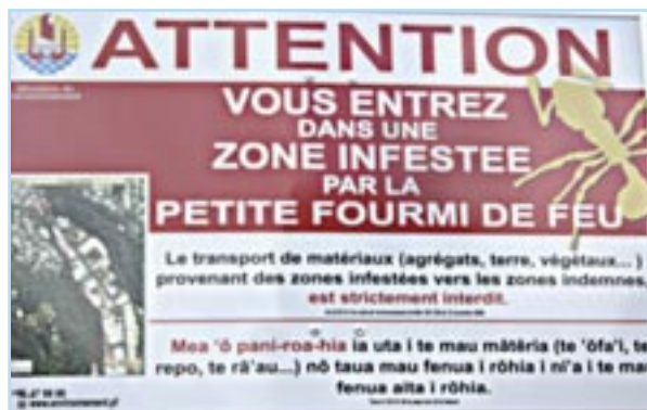
Pancarte indiquant le commencement de l'aire des fourmis de feu.

Les fourmis de feu colonisent progressivement toute la zone urbaine malgré les traitements aux pesticides . On compte environ une centaine de foyers entre Mahina et Faa'a.