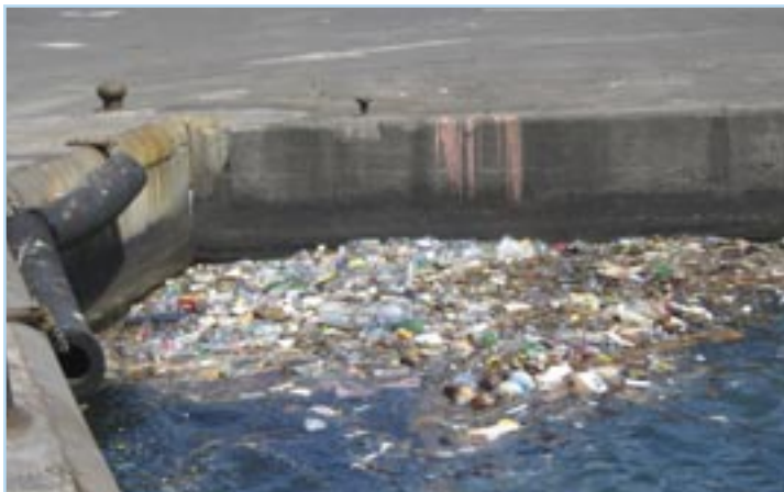
Dans le port de Papeete...