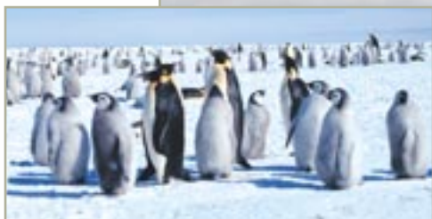
Une colonie de manchots empereurs.