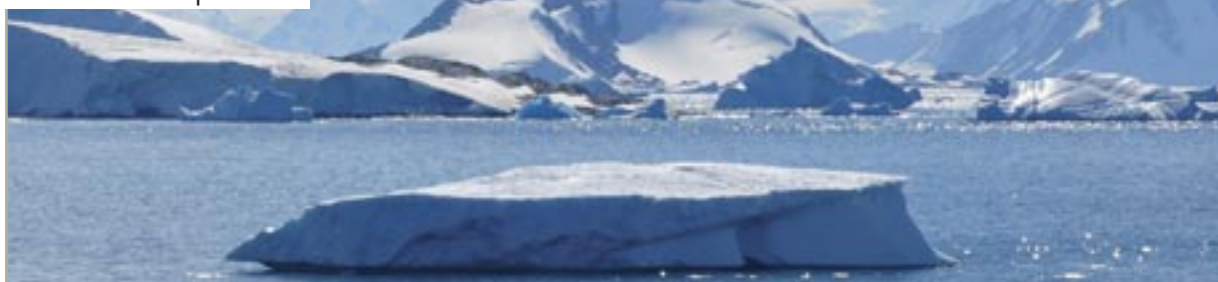
Des icebergs se détachent du continent couvert de glace.